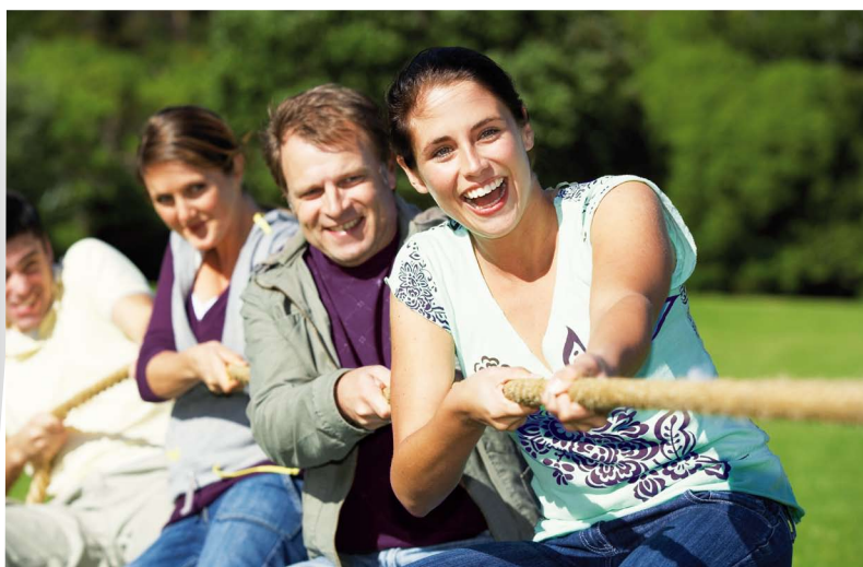
winPlateforme : la puissance du groupe, sans effort !